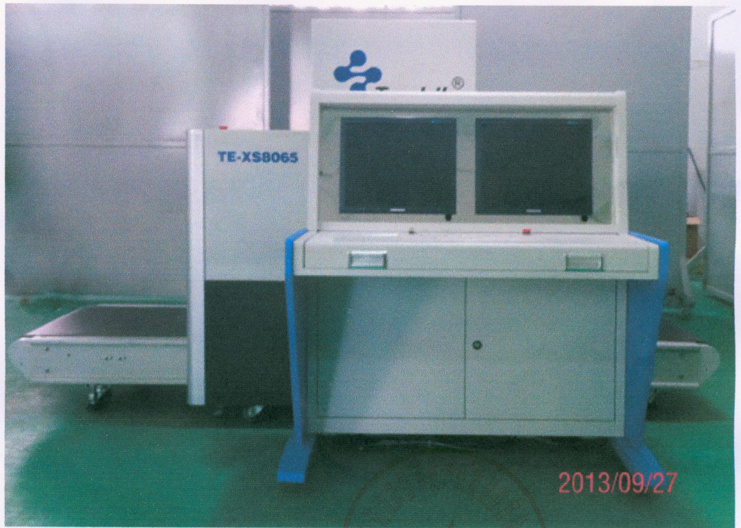
TE-XS8065 型 X 射线安检设备样品